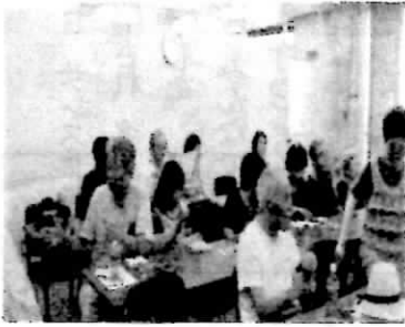
数字をあげての説明に怒りがー

大企業への大幅な減税のしわよせで、社会保障は削られ、暮らしは苦しくなるばかり……。暮らしと命を守るため、年金と社会保障の充実を求めていく運動の必要を感じました。