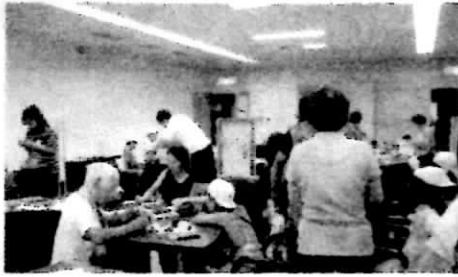
大にぎわいのコーナーで 大活躍の仲間