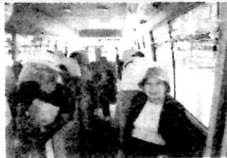
バスの送迎はありがたいです

療 や手術を受 けられた方、 毎年ご自分 の健康状態の チェックと位 置づけている 方、一人では 受けにくい健