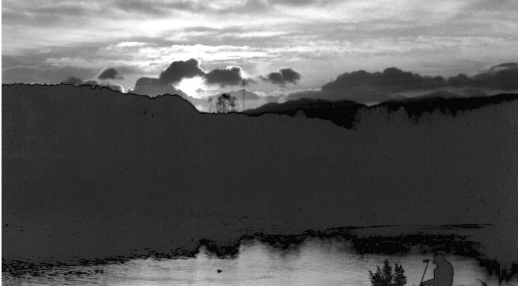
大泉公園のもみじ橋からの初日の出

その1つは、サークル活動の他、おしゃべりカフェが定着したことです。また、組合員が増えたことも大きな発展でした。社会的な発言力が広がりました。北区役所に介護保険制度の改善について申し入れを行い、回答を得ました。年末には年金カット法案が通ってしまいましたが、府本部では、年金裁判が行われています。介護保険の改悪、原発再稼働など国民の願いとはかけ離れた政治に憤りを覚え、改善の声をあげています。