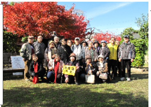
鮮やかな紅葉の庭で

のグループに分かれて、加賀屋新田会所跡を見学しました。真つ赤な紅葉に彩られた250年昔の豪商の屋敷跡に目を見張りました。池や築山は、小堀遠州風の庭園で、かつては舟も乗り入れていたとのことでした。茶室も凝った造りでした。長屋門、冠木門、旧書院も見事でした。江戸時代に両替商から新