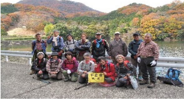
まだまだ紅葉の池のほとりで