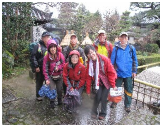
雨の中、健気に咲く寒牡丹

今年初の例会は、1月8日、高取城址方面で阿倍野橋駅集合。参加者8名。当日の天気予報は午後から雨。急遽二上山に変更。雨は予報より早く降り出した為、安全第一で山登