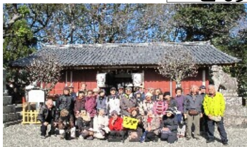
「上神谷戎」を控えた社前で

昼前には、泉ヶ丘で散会。歩く距離も今までの中で一番短くて歩き足りない8人はさらに光明池まで足を延ばし、美多禰神社まで行かれたそうですよ。