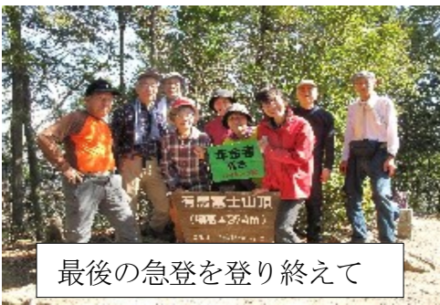
最後の急登を登り終えて

打ち直ししなければならぬ」と苦情をいわれ、この際八十代の手習いで、パソコン教室に入会させていただきました。まずはワードが出来ることを目標に、毎回お弁当を持って参加しています。パソコンはなかなか思うように操作が出来