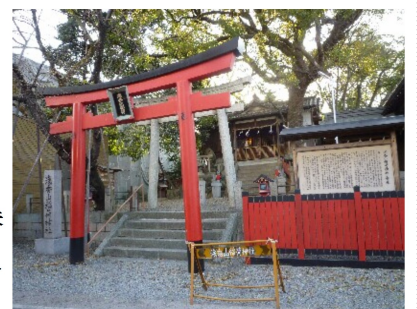
いわれのある浅香稻荷