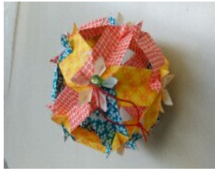
「くす玉」 河内 都