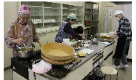
みんなで作ると楽しさも倍に

任を持って巻き、完食です。子育てに頑張っていた時はよく巻いたが、久しぶりという人が多かったです。初めての人、米つぶが手についている人、具が中心にこない人、と賑やかな時を過ごしました。別腹で桜餅もいただきました。楽しく、美味しく、