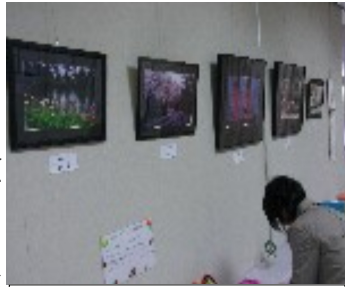
熱心に見入る見学者

第8回「輝け展」は、堺の4つの支部が実行委員会を作り、4月1日、2日の両日、サン