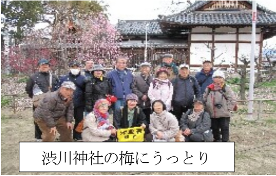
渋川神社の梅にうっとり

次に安中新田会所跡の植田住宅に行く。若者のグループについていき、ガイドを受ける。