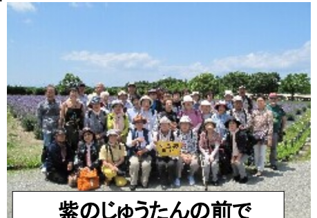
紫のじゅうたんの前で

今回は、ラベンダーを見に、和泉リサイクル環境公園に行ってきました。38名の参加者がありました。この公園は、産業廃棄物の最終処分場から生まれた