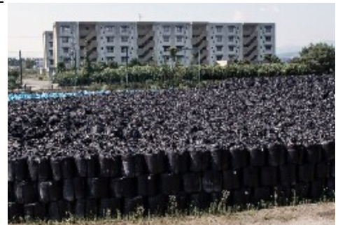
積み上げられ続ける放射能土壌袋

応仮置き場というところになっていくが、住民が帰還できないのをいいことに半永久的な置き場になるのを目論んでいるそうだ。山も汚染されているが、処理のしようがない。