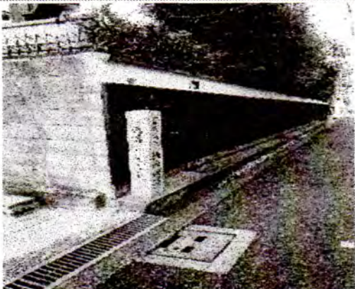
竹内街道と記した道標