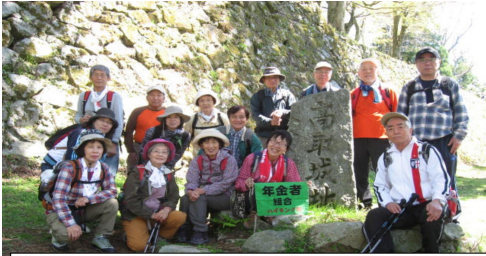
城址の石垣と新緑に囲まれて