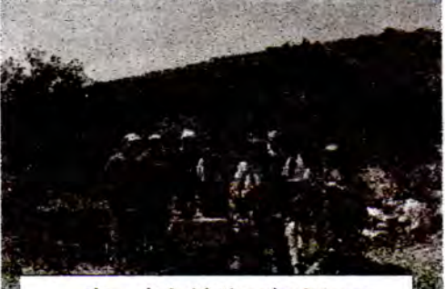
真っ赤な絨毯に包まれて

ん登山者であふれていました。今年はずつじの開花も遅かったせい、この時期としては、絨毯を敷き詰めたような美しさで、眺めながら食べた弁当は格別でした。 下山はほとんどが