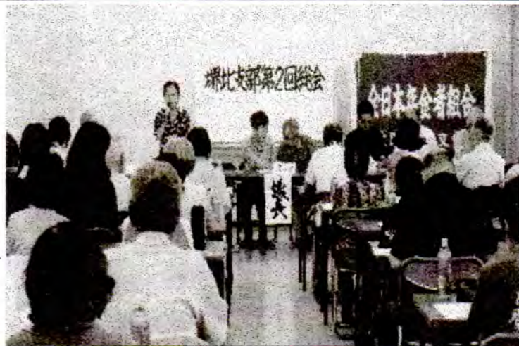
つぎつぎと発言が相次ぎました。

堺北支部は、6月16日に総会を開き、これからの1年間の方向を、熱気の中で確認しました。