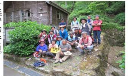
あじさいとヤマボウシの咲くくさか園地で