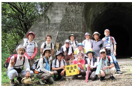
廃線のトンネルの前で

9月の第2日曜日、武庫川溪谷廃線跡を12名で歩きました。大阪の郊外にこんな綺麗な溪谷が身近にあるなんて知りませんでした。懐中電灯を手に薄暗いトンネルをいく