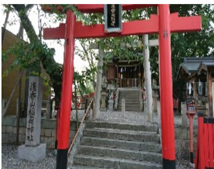
姿を現した浅香山稲荷