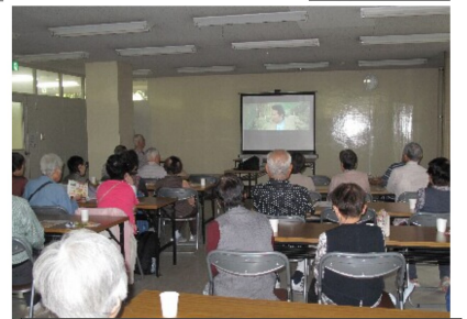
会場いっぱい笑い声が

☆久しぶりに見ておも しろかったです。無 責任だけど、純粋な 寅さん、愛せる人物 でほのぼのしてきま した。 布施仁志