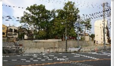
東浅香山町1丁西地点

近で遊んでいた思い出を語ってくれました。浅香山の上にある神社の周りには住宅でなく田んぼや畑があり、大和川まで続