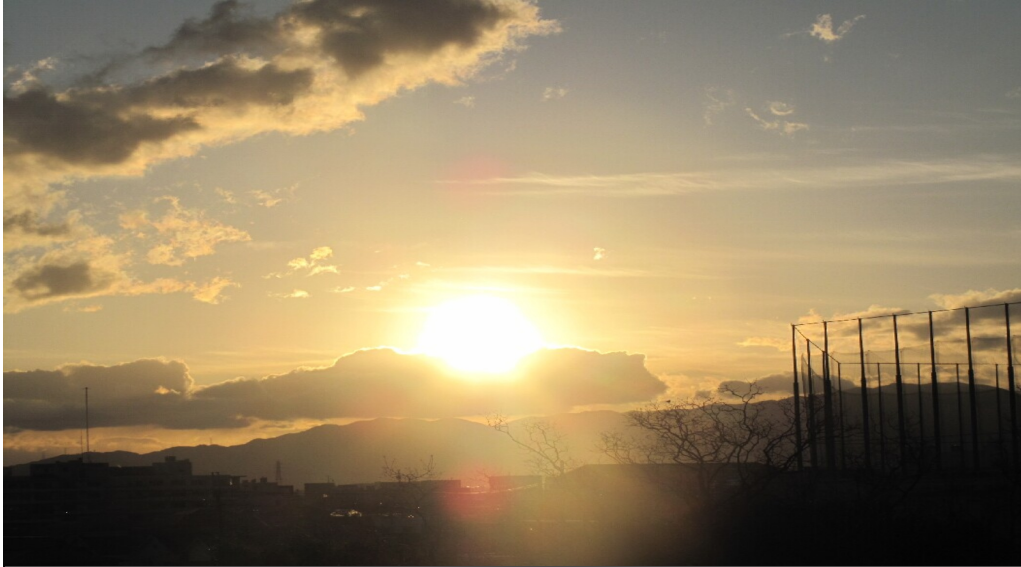
大泉公園からの初日の出