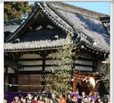
初詣の人で賑わう八幡さん

江戸時代頃になると、御廟山古墳の島には、柴(原生林による)が生い茂り、百舌鳥村の強気のお百姓さんが一人柴刈りに出かけました。他の村人はその昔から、この島を恐れて誰一人近寄らなかった所でしたが、島の奥へ進んでいった時、突然雷光あたりがカーと照らし出され、強気のお百姓も目がくらんで、立ちすくんでしまいました。お百姓の目の前に現れたのは、白衣に身を包んだ老翁でした。「我は八幡大明神なるぞ。わが住まいを侵す不届きものめが！知らずして…」とあいなり、この村では、八幡大明神を祀り、肉食をとらない精進(百舌鳥精進)を今でも1月にしているそうです。「体の中の血がきれいになり、1年間健康でいられるような気がする」とは、今でもされている方の話。