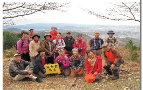
眺望とおしゃべりで楽しく

雄岳へも、これまで通っていない道を行つた。帰りは、こがんこの忘年会で盛り上がった。西村恒男