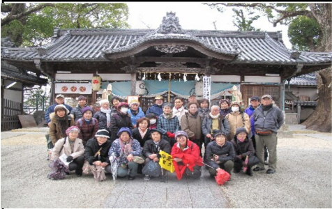
破風の屋根が印象的な神社

戊年最初の歴史散歩は1月5日。津久野駅10時30分集合、参加者29名である。行程は因念寺から踞尾神社へ。因念寺は創立沿革は不明。15世紀後期蓮如上人から寺号を下付された浄土真宗の寺。本堂の立派さに参加者は感嘆していた。