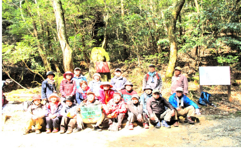
首切り地蔵のところに出てきました