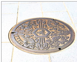
モズとショウブとツツジの花

15 最近、若い人のあいだで日本全国の下水マンホールマニアが増えていることは、ご存知でしょうか？