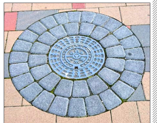
仁徳陵東側の葺石風マンホール（電話線）

また、堺市の下水マンホールをじっくり見られたことがありますか？「うすい」と「おすい」の2種類ですが、「うすい」には、堺市の鳥である百舌鳥、花のショウブ、花木のつつじ、そして柳の木のイラスト画が描かれています。「おすい」には、2代目の灯火部分である堺灯台と南蛮船の図柄と、「市制100周年、平成元年合流」の文字が書かれています。