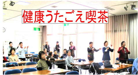
健康うたごえ喫茶