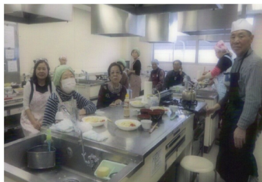
みんなで作るとおいしさも倍増

大皿に盛ったたっぷりのコールスローを先にいただき、ご飯に味噌汁と、健康的で美味しくて大満足でした。