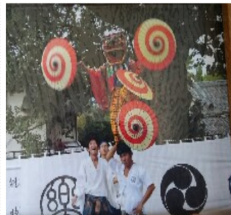
これぞ伝統の技、お神楽の舞

由緒ある金岡神社の勇壮な盆踊り祭りは、北区にお住まいの方で知らない人がいないくらいですが、お神楽が、ここ7年前から復活したことをご存知でしょうか？