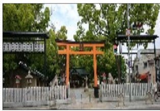
由緒ある金岡神社