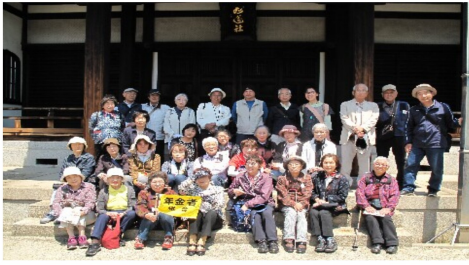
元堺県裁判所だった旭蓮社は風格があり…