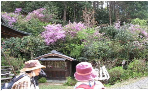
インクラインから上がって日向神社へ