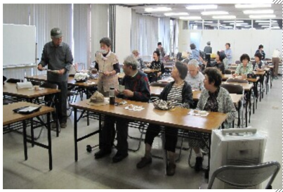
会場はいつも和やかです