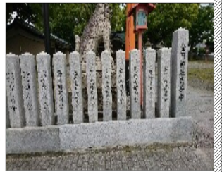
地域の方の願いを集めて

DVDを見せていただきましたが、伝統行事にありがちな、現代人から見ると意味不明なことがなく、ちっとも退屈さを感じませんでした。子どもから大人、年寄りまで、見るひとすべて芸の深さに魅入られていました。一度見に行ってください！