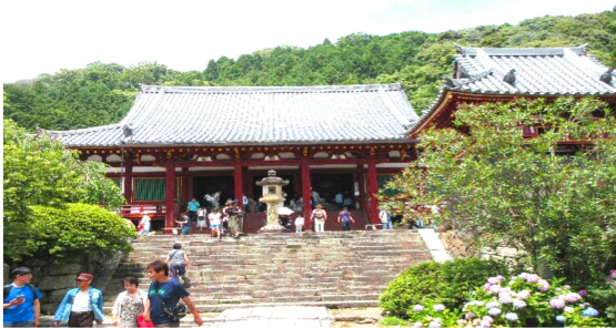
歴史のある矢田寺の本堂の階段を上がる