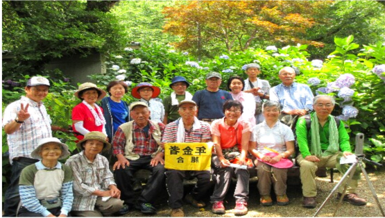
真っ盛りのあじさいに包まれてごきげん