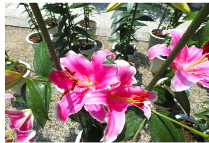
松尾寺のカサブランカ

5月18日、府の女性部の浜寺公園ツアーに参加しました。満開は過ぎていましたが、バラの色々な種類の説明を聞いて感心しました。また珍しい品の白松を初めて見て、嬉しかったです。葉の緑が一緒ですが、幹が白い松です。