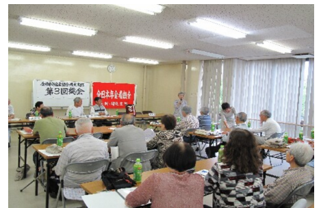
発言が相次ぎました

☆今日初めて出席。何か今まで見た総会とは一味も二味も違った、と感じました。サークルの内容も、聞くだけでも参加したいと思う内容。サークルの話し合う場を持つてほしい。麻雀部の話が出ていま