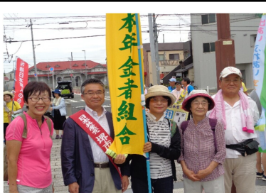
夏を伝える思いへの平和

7月3日、心配された雨にも降られず、平和行進に参加しました。北支部からは10名でした。