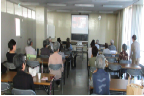
歌とダンスが懐かしく…