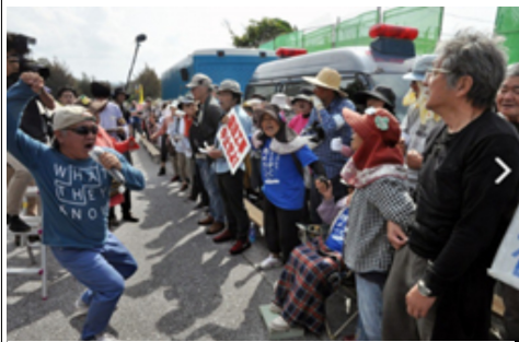
辺野古に基地を造るなエイエイオー