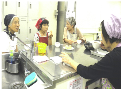
できたきんづばに舌鼓