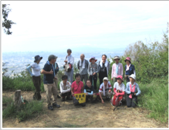
展望のきく山頂にて

7・8月は夏休み、前回は雨で中止。9月23日久しがりにハイキング仲間16名が参加し、快晴の中、河内飯盛山に登りました。標高は314・3mと手軽に登れるコースでした。 JR野崎駅から野崎観音を抜け飯盛山へ、長い階段が続きます。 今夏は暑すぎて蚊もいなくなったのですが、今頃になっていっばい発生し、また