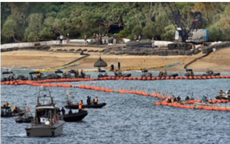
ブイに囲まれた辺野古の海