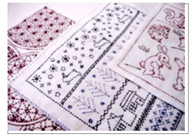
炊飯器などにパラリとかけて…