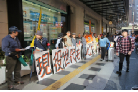
年金引き下げはごめんです