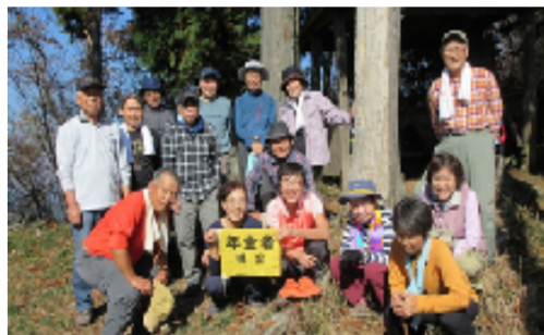
紅葉のまったただ中の山頂にて

11月11日、上本町8時集合。15分発の電車に乗り榛原駅着。榛原よりバスが利用できるが、時間が合わずタクシーに乗り込む。今回は16名の参加である。