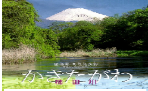
美しく澄んだ水に戻った柿田川

創りだす過剰な湧き水にうつとりしながらも、私たち住民のためにならないと思っただと、心は躍っていました。