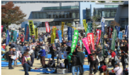
歌と踊りでにぎやかにアピール

11月3日、扇町公園に1万5000人がピクニックシートを敷いて集いました。9条改憲ストップ！東アジアに平和を！辺野古に基地はいらない！と声をあげました。