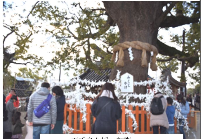
百舌鳥八幡へ初詣

新しい年を迎えてご挨拶を申し上げます。最近 は新年を「おめでとう」と素直に祝えないことが 続いています。