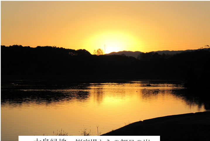
大泉緑地 桜広場からの初日の出