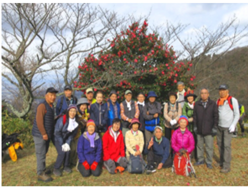
山茶花の咲き乱れる山頂で

枯泉寺を経て、岩屋峠の道を行く。まだ紅葉が残っていて美しかった。岩屋の石切場や仏像を見て、雌岳へ。休憩場で弁当。きれいなヤマガラも来て、エサをあげた。抜け道を通り、雄岳の山頂へ。