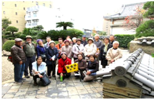
祥雲寺の庭園にて