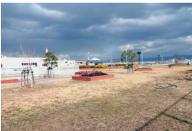
処理棟屋上の風の広場

堺市と松原市の境に今井戸川が流れています。1982年、大雨で大和川の水が逆流し、常磐町一帯で床上140cmの大水害となりました。今井戸川の水を排水するポンプ場をつくるため、大和川の堤防を切り開いていたのです。その後、激甚災害指定でその対策工事が一気にすすみ、1985年6月西除川ショートカットと今池処理場（水みらいセンター）、そして、今井戸川ポンプ場も9月に完成しました。