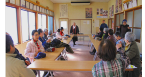
ご住職の雷を閉じこめたお話が面白い