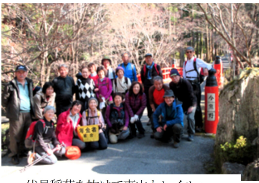
伏見稲荷を抜けて東山トレイルへ

中腹回りから 京都トレイル東 山コースに入り 清水山に向かう。 山の中の日当 りのよい空気