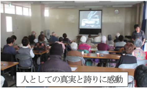
人としての真実と誇りに感動

の東海道を歩く 京三条から江戸日本橋までの東海道五十三次ウォークを始めてはや1年。愛知県桑名まで来ました。昔の人が藁草履で歩いた道のり、宿場、本陣、高札場、一里塚をたよりに辿る。悪い道、暗がり歩いた昔の人の苦労がしのばれ、一生帰って来れないのではとさぞ不安だっただろうと思