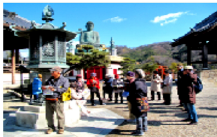
極楽寺の境内で錦溪大仏の説明

つ記念碑を見て、次は吉年邸、長野神社、由緒ある西代神社、次は三笑橋、極楽寺へと。