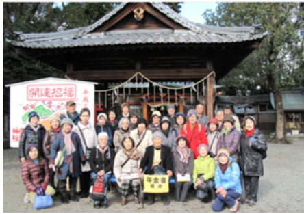
由緒ある西代神社にて