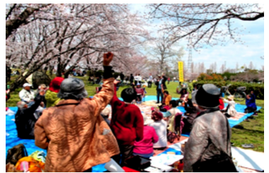
みんなで元気になりました