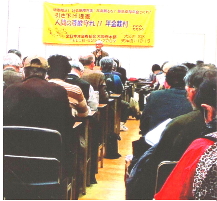
年金は私たちの命綱です