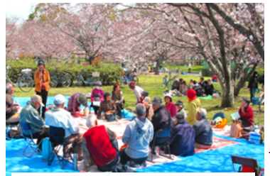
歌とクイズで湧きました