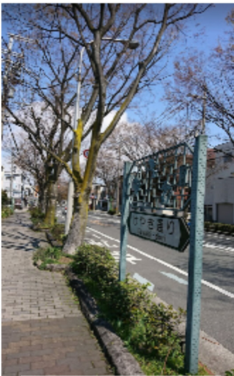
旧天王貯水池付近の けやき通り

北区ではないのですが、 長尾街道を西に歩いていく と大阪刑務所のはずれで 「田出井町」の交差点に出 ます。この交差点から、南 に約1km道路の両側に「ケ ヤキ」が植えられた「けや き通り」があります。その けやき通りに「旧天王貯水 池」があります。