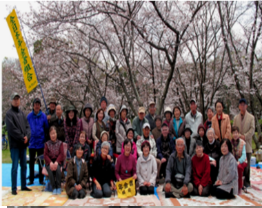
満開の桜の下でにっこり