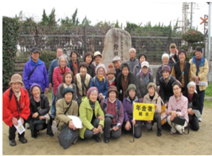
野田城跡の石碑の前で