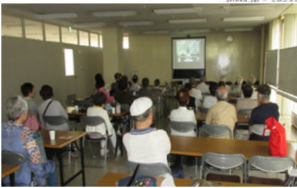
駅馬車の懐かしい画面に引き込まれました