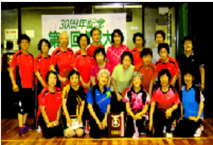
優勝盾を囲んで笑顔满面