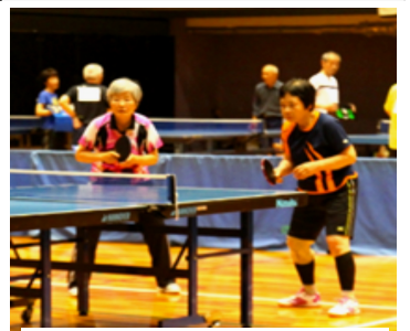
息づまる熱戦を制して

で、やる気満々の選手たちが集って、今年も盛大に行われました。緊張も高まっていいよ