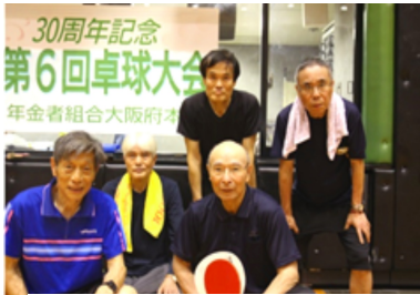
健闘の後は反省会で...