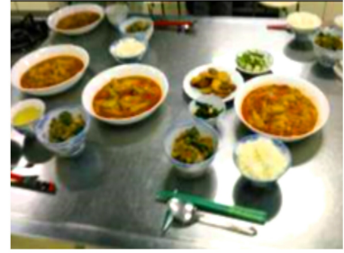
おからハンバーグとクラムチャウダー