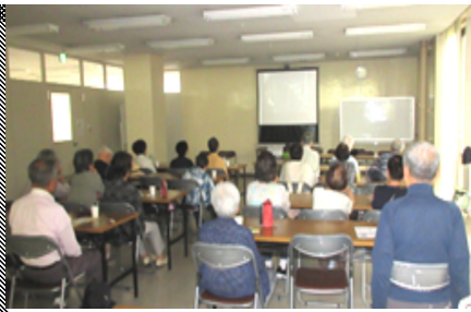
黒澤明の世界にひきこまれました

7月3日、14名で、「七人の侍」を観ました。戦国時代のある貧しい農村が舞台。農民たちは、野盗と化した野武士の襲