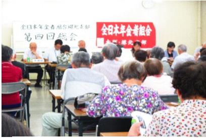
多くの参加者で会場は一杯

6月21日、市民センターで、堺北支部第4回総会が、開催され、66名の方が参加しました。