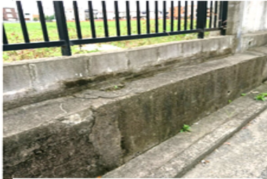
今なお残る強固な塊の塀の基礎

この間、大阪は、G20 開催で交通網から市民 生活まで不便な思いを しました。堺市はさほ ど影響は感じられなか ったけど、上空を飛ぶ ヘリの音が、かなりうる さかったですね。