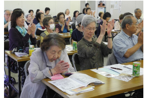
発言に拍手が起こりました

合の様子の話も出て、歴史を知ることができました。サークルや色んな取り組みで、16名の方が次々と発言されました。新役員を選んだ、盛り上がった総会になりました。