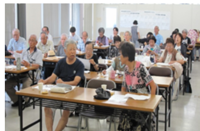
次々と質問にも答えていただきました