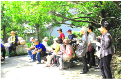
曼珠沙華の咲く大津池