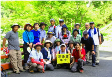
溪流と緑の美しい清滝にて

途中からハイキングコースに入る。前に進むと川の水も透明度が増し、気持ちが良い。清滝橋から落合橋にかけての清滝流域