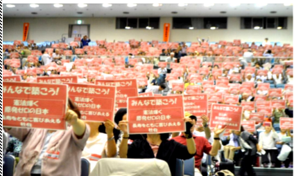
原発NO！で埋めつくされた会場と質