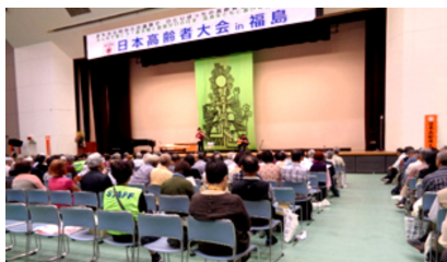
高齢者のパワー全開