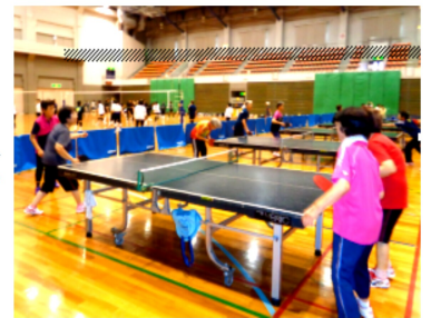
楽しく汗を流して練習

卓球が好きだと言うことです。いつも20名以上の参加で、所定の台数は9台ですが1台増やして練習