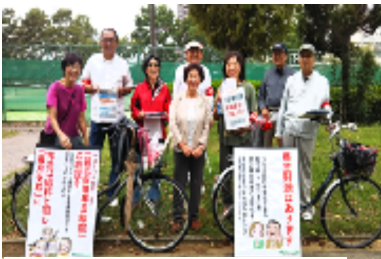
戦争NO! 安倍NO! をアピール

10月14日体育の日、市民オリピック開催中の金岡公園で、年金署名と、台風・豪雨による災害支援の募金活動を行いました。参加人数は8名でした。豪雨による甚大な被害がマスコミで報道されている最中