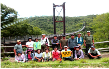
大吊り橋を背にポーズ

台風の去った10月13日（日）、ハイキング部17名は交野市の「星のブランコ」に行きました。 京阪電車交野線ターミナル私市駅から出発、整備されたハイキングコースを1時間足らずでビトンの小屋に到着。そこには関西最大で平成9年なみはや国体の競技場で使われた「クライミングウォール」