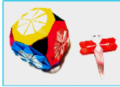
手まりと赤トンボ