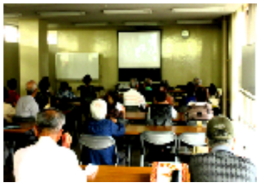
生きる意味を考えさせられました