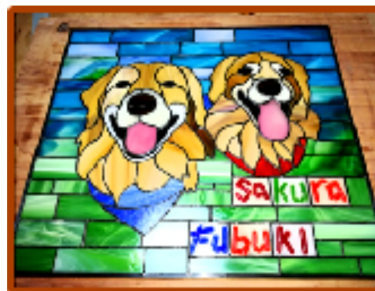
ステンドグラス 趣味で始めて4年目、我が家の愛犬と知人の「さくら・ふぶき」