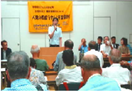
年金減額は違法・勝利判決を！

10月8日、第17回年金裁判がありました。府本部は、事前に、公正な判決を求める署名1万人分を大阪地裁に提出しています。今回は、5名の原告（学者・現役労働者・障害者・女性・年金者組合役員）に、5名の弁護士が聞くという形で、中身の濃い証人尋問を行いました。マクロ経済スライドで、年金を下げるのは違憲である。ILOに来年秋に提訴しよう。年金制度は、全世代の大きな問題である。など、裁判官に訴えました。午後には、報告集会を開き、次の裁判の結