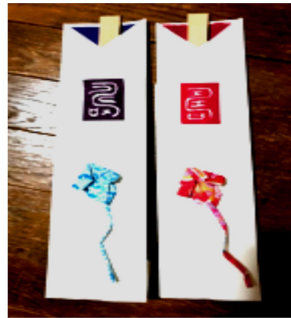
半紙と和紙で作った お正月の祝箸の袋