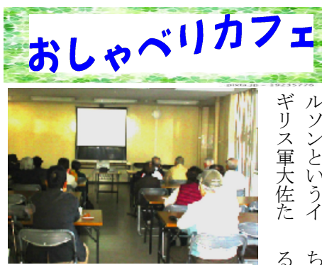
戦争のむごさと虚しさが胸に迫る

していた。斉藤はやきもきの建設の主導権を移すことを条件に、建設に携わることを申し出る。見事な橋が完成した。脱走した