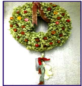
ドライフラワーにしたアナベル と貝殻草のリース