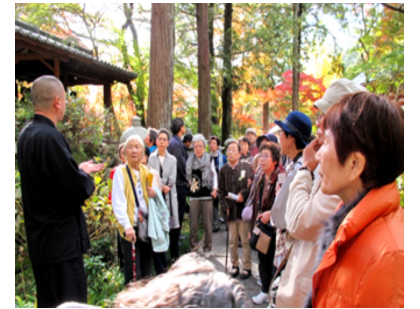
住職さんからお寺の由来を聞きました

☆初めに久安寺に行き拝観し、日吉ダム、その後、生身天満宮を拝観しました。係の方に説明をして頂きました。ただ、ダムで地下におりた人5、6人。おりなかつた人多数。ダムは誰も説明してくれない人がいなくて残念でした。紅葉はとってもきれいでした。