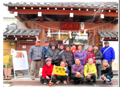
仏像を間近で見せて頂きました

の辞世の句です。冬ざれは冬になって、荒涼とした様子をいいます。冬枯れは草木が枯れた寂しい冬の景色。彼園は枯れた庭を表します。冬の初めは初冬や孟冬 もうとう 、冬の盛りは盛冬、冬の終わりは冬の奥、晩冬、窮冬といえます。冬の終わりは春を待つ季節でもあります。