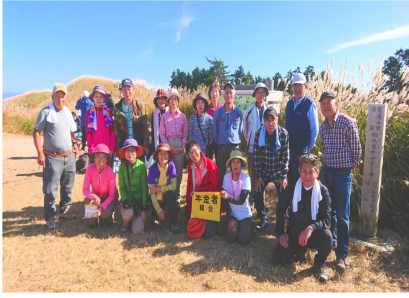
秋たけなわ ススキに囲まれてチーズ

登山道に入ると、いきなりの急坂。杉林の中を2時間半かけ登りきると、山頂はススキに囲まれた金色の世界、眺望も抜群で大阪を一望。山頂で