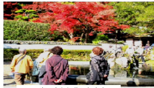
真っ赤な紅葉の久安寺