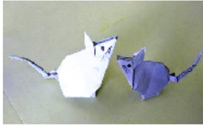
干支のねずみ親子