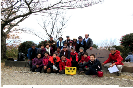
弁当を食べた後も笑いが絶えません

葛城二上神社をお参りして下山。忘年会の時間調整のため回り道をしました。赤や黄色に紅葉した山の