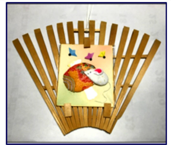
和紙の貼り絵のねずみ