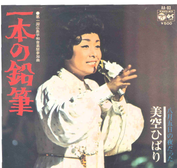
第1回広島世界平和音楽祭にてひばり初演直後発売の「一本の鉛筆」の初版ドーナツ盤のジャケット写真 コロムビアレコード 発売 (S 59年9月) レコード番号: AA-83