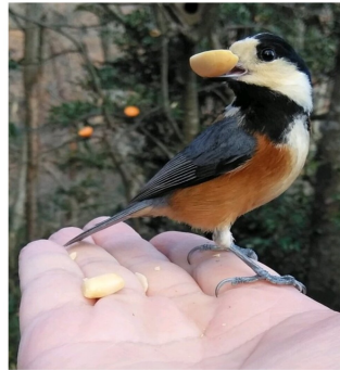
野鳥に餌やり成功 二上山の山頂でヤマガラがピーナッツをパクリの写真