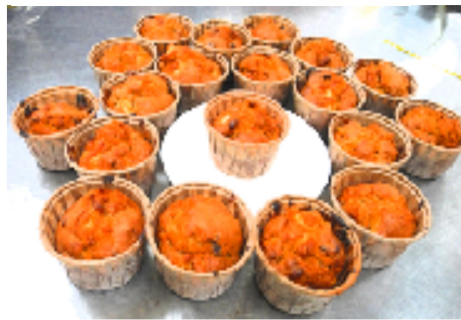
おいしいケーキができました

12月はケーキ作り。林檎ゴロゴロ、干し葡萄に胡桃とおいしいケーキの作り方を教えていただき楽しい時間でした。23日にケーキを作って子供たちにプレゼントします。