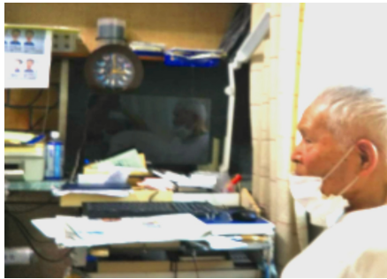
愛用のパソコンの前で