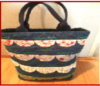
パッチワークのバッグ