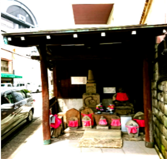
お地藏さんと宝篋（きょう）印塔