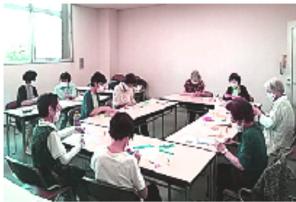
平和の心でさまざまな作品に挑戦

折り紙は、平和の心。2009年8月、6名から始めた。めた会は、早いもので11年目を迎えました。