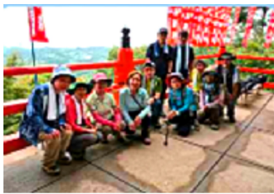
信貴山で久しぶりの達成感にひたる

集合場所には、12名。久しぶりの再会を喜び合う。近鉄服部川駅下車。今日は、立石越ハイキングコースを歩き、信貴山を目指す。立石越は、急坂、荒廃、雨あがりの悪条件が重なり歩きづらかった。