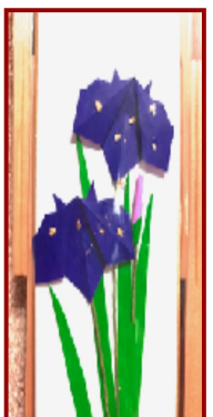
折り紙で色紙に貼っています