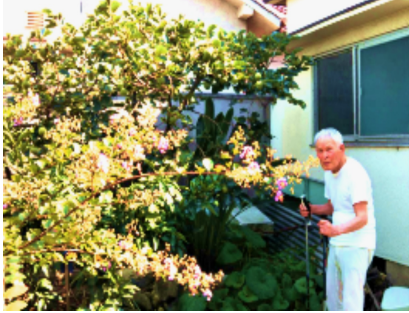
常磐町のご自宅の庭にて

小学校は、教育勸語中心の軍国教育一色。6年生になったとき、優秀をつけたクラス替えがあった。金持ちの子だけが補習を受け、自分たちは分からず、頭から押さえつけられて、勉強がいやになった。男30人いた中、2、3人が中学校へ、他は高等小学校へ。高等小2年の時、技能養成工になった。3年では、寮生活