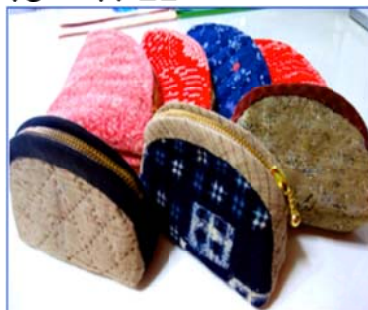
小銭入れを沢山作りました