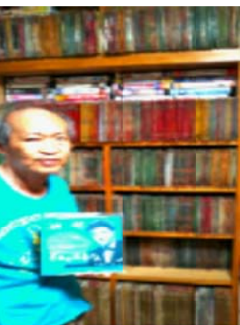
膨大な量のレコードの棚…

大阪市の特別区になつたら、隣接する堺市はじめ10の市が住民投票なしで議会の決議で特別区になり、その隣の市へと特