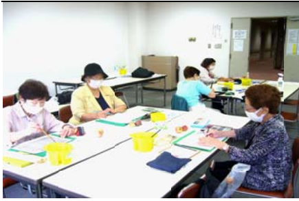
久びさの例会で気持ちが入りました