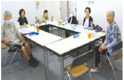
課題書を軸に話が弾みます