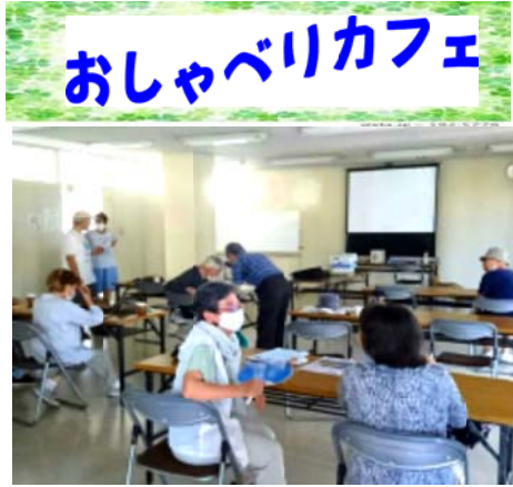
映画の前の談話も楽しい

す。金持ち金持ちと言っていたが、金持ちが幸せではない。今度はおもったいいのをしてほしい。