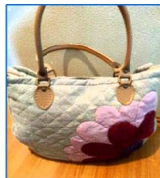
パッチワークのバッグ