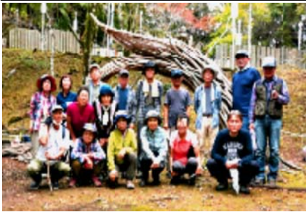
稜線の開けた場でドローンでの撮影。

前日まで台風の影響で連日の雨だったが当日は雨も上がり今日のハイキングは決行だ。だが予定の初谷溪谷コースは水量を懸念して少し距離の短い大堂越コースを登ることになった。 この日の参加者は17名、阪急梅田駅から約1時間で能勢妙見口駅に到着。朝の挨拶もそこそこに10時前駅前を出発。