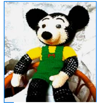
毛糸でミッキーマウス君