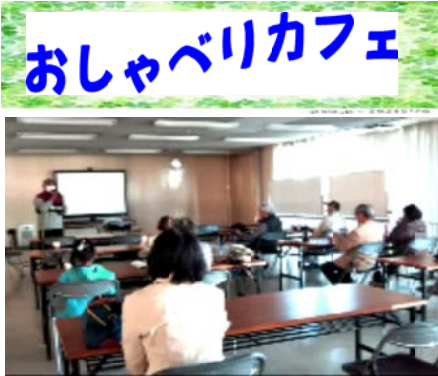
笑いの中に素朴の大切さが...

昔、村はずれに、乱暴者の少年戦車兵上がりの男・サブが、耳の遠い母親・とみと、頭の弱い弟・兵六と一緒に暮らしていました。