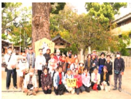
阿麻美許曾神社の大きくすのきの前で