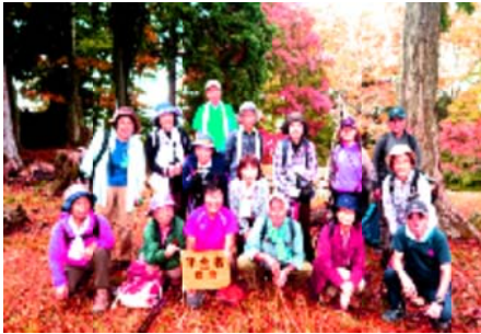
石垣と紅葉に秋を満喫して...

下山は登りと打って変わって小石がごろごろした歩きにくい道が続いたが、国見橋からは奈良盆地や二上山、さらに大阪