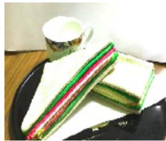
サンドイッチのポーチ