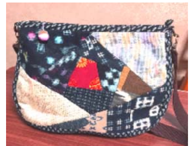
パッチワークのショルダーバック