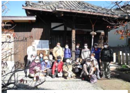
ちち薬師堂・雷井戸を見て

下山は登りと打って変わって小石がごろごろした歩きにくい道が続いたが、国見橋からは奈良盆地や二上山、さらに大阪