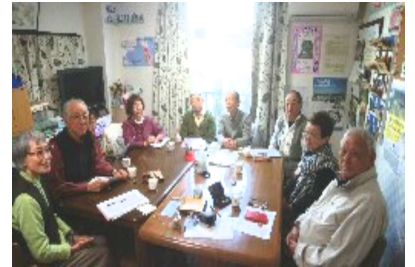
和気あいあい実力アップ

初冬の晴れた日に、わずかに舞う小雪を風花といいますが風で舞いあげられたりするものもいます。風花は俳句の季語でもあります。雪の花は雪を花にたとえた言葉。銀花、天花も雪のことです。六角形の結晶の形から六花も雪の異称です。牡丹雪、花弁雪は、