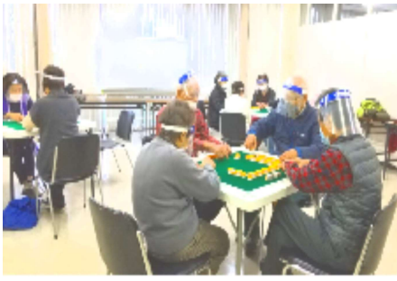
会員も雀卓も例会も増えました

麻雀の会 も多くの問題が立ち塞がっています。麻雀の会に於いては、発足時から「コロナ感染は「しない」「やせない」