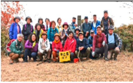
雌岳山頂で展望を楽しみながら...

6合目辺りから傾斜が本格的に。何処もかしこも枯れ葉の絨毯。雄岳山頂付近の景観はいまいち。馬の背に降りて雌岳に向けて上る。少し