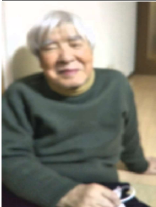
金岡町のご自宅にて