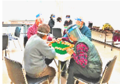
初心者も今では対等に勝負

石混交の船出。「わあ困った、どれ捨てたらいいの、見てみて」と優しいリーダーに教えてもらっていたのが、今では対等に興じ、そこは勝負の世界。たまにはベテランを負かすことも。