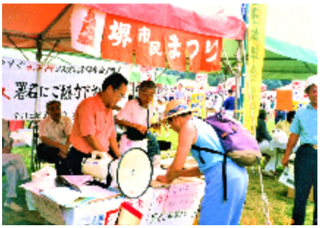
堺市民まつりで署名行動 (1993年)

旭区の大宮町に移った。父が亡くなったのは、15歳の中学の入学に合格した時だった。それで、入学できず、一日中家で泣いていた。6男2女の3番目だったが、兄2人は兵隊に行き、食べるために働かなければならなくなった。港区の田中機械製作所へ働きに出た。初めは何も出来ず、事務所の給仕だった。小さい体で、30人分のお茶を運ぶのがつらかった。1階の小使室から2階の事務所に運ぶのにこぼしたことも度々。やっと給仕から現場の機械仕上げに移った。機械組立工として、15歳から20歳まで働いた。