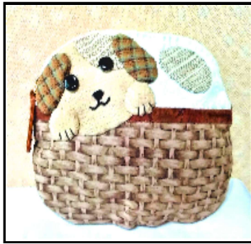
ワンちゃんの小物入れ