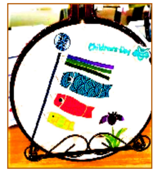
デコパージュで作った鯉のぼり