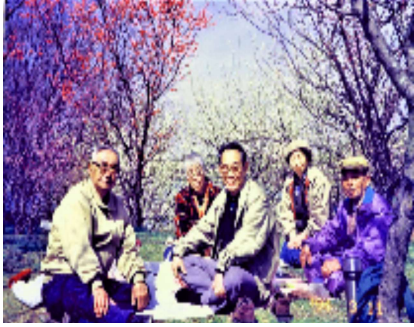
大泉梅林にて花見 (1994年)

航空隊へ 召集令状が来た。軍事訓練を経て、島根県の航空隊へ入隊。入隊1カ月で、航技兵として満州へ派遣。5月頃だったと思う。チチハルへ転属し、航空隊員となった。終戦近くまでいたが、飛行機が無く、2枚羽根の練習機だった。移動命令が出て、ハルビンへ。そこで終戦を迎えた。負けるとは思っていなかった。武装解除を受け、生きるために西安炭坑で働いた。解放军に引き渡され、しばらくは解放军の軍需工場で働いた。やっと落ち着いたのは、解放軍管理下の砂金場。日本人もたくさんいた。21歳ぐらいだ。