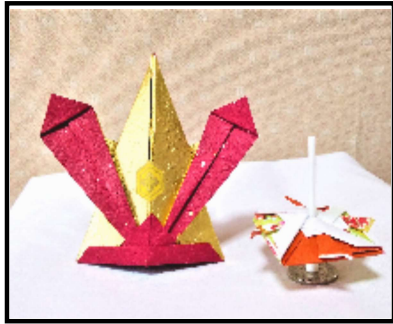
節句の兜と兜のコマ回し