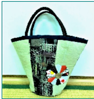
パッチワークのバケツ型バッグ