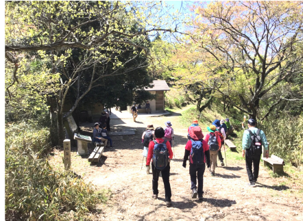
いくつもの峰を越えて辿りつきました