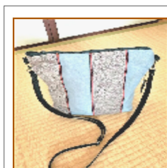
ショルダーバッグ