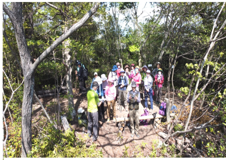
麻呂子山山頂で…ドローン撮影に湧く