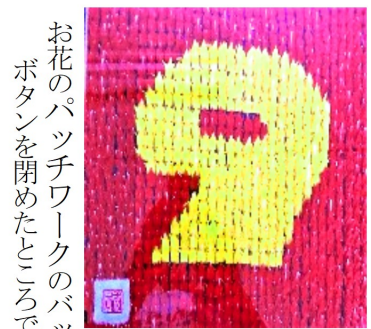
お花のパッチワークのバッグ ボタンを閉めたところです。