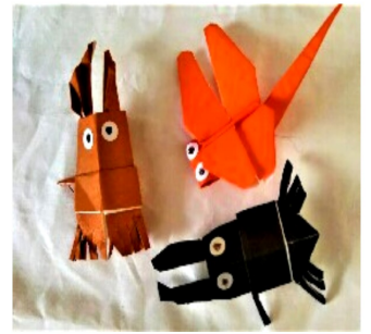
秋の虫を折り紙で。膨らませています。