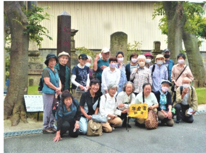
村境石造物群の供養塔の前で