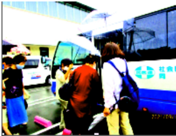
あいにくの雨でも配車のバスで

今年が初めての方が5名ですが、日常的に年金組合活動を通じて交流をされていることもあって、車中は近況を確かめ合うなど穏やかな雰囲気の中、7カ所の待合場所を回り、耳原病院へ向かいました。昨年までは、長井一人での引率していく状態でしたが、今年から、2名の助っ人組合員の援助を