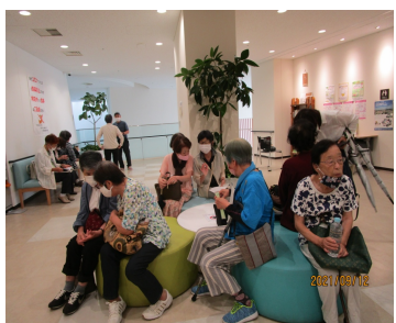
待合場でも和気あいあいで...

毎回、長年検診を受け続けてくださる組合員さんの加齢に伴う心身状態の変化に、健診時に必要