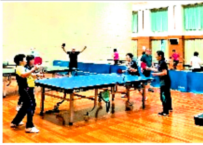
小体育室で楽しく練習

スタートして半年ぐら いで、訳もわからず大会に参 加という大きな体験をさせ てもらったことでもう少し 上手になりたいという気持 ちがふつふつと湧い て来て、教室にも通 うようになり、今に 至っています。大会 となれば、ワクワク よりドキドキですが、