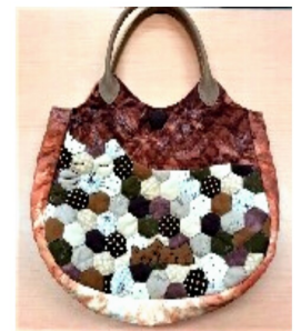
パッチワークのバッグ