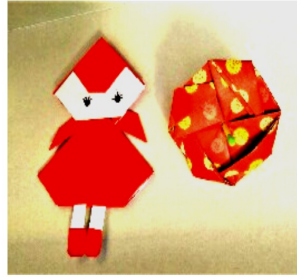
赤ずきんちゃんとコマ