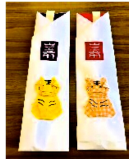
折り紙で来年の干支の寅を折って貼り付けた祝箸