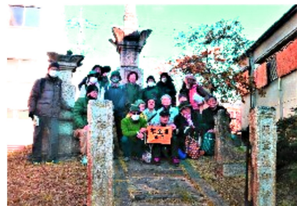
歴史のある榎宝篋印塔にて