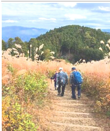
満開のススキの草原に行く

ここから山頂へと進んでいく階段はとても長いが秋の日差しの中、白いススキの穂一面に囲まれながらの足どりは疲れが吹っ飛び軽くなってくる。そして標高897mの山頂へとゴール。岩湧山には個人でもよく出かけるが今日の山頂からの眺めは遠方まで良く見え、とびつきりいい。360度のパノラマ展望の見晴らしです。昼食をとり恒例のドローン撮影にはテンションが上がる。ハイキング後に送っていただく