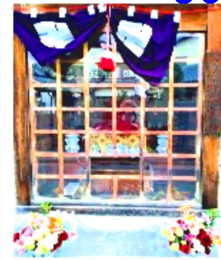
九頭龍(くすがみ)地蔵様

にあるお地蔵様です。祠の左側に置かれた青いポリバケツに大きな字で「金岡地蔵」と書かれていますので、その名前だと思い込んでいました。しかし祠の前の1対の燈籠には「九頭龍地蔵大神御寶前」と。九頭龍の伝説はたくさんあるのですが、近所のご長老は、江戸時代の中頃に人々が信仰した九つの頭を持つ神様のお話をしてくれました。九頭神とかいて「くすがみ」と呼ばれました。