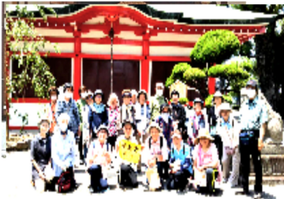
長曾根神社でハイチーズ

境内の河内鑄物師の梵鐘は、大晦日にはぜひ聞きにきたいものだ。長曾根神社で記念撮影。自己紹介。