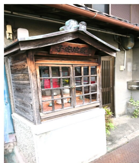
4丁の、まだ祠の中におられたお地蔵様