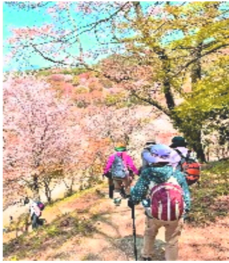
行く道の桜の満開

私たちはハイキングコースから道路に出て、下千本、中千本、上千本と歩きましたが、まるで心斎橋を歩いているような感じで人の流れに沿って歩くしかありません。上に行くほど急坂になり、休憩を取りながら歩きました。