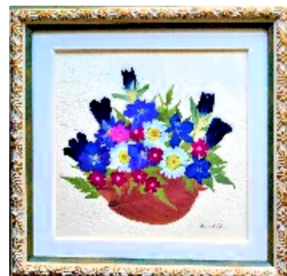
光と空気にデリケートな押し花ですが、20年以上過ぎてても色褪せてないので、気に入っています