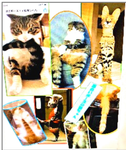
猫のポーズいろいろの組写真