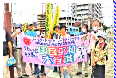
平和行進の方とともに…

7月3日午後2時、蒸し暑かったものの、朝の雨が止み、浜寺公園にたくさんの旗が集まりました。5月6日に東京を出発し、リレーでつないだ行進者が到着。