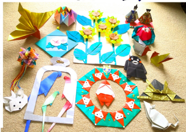
これまでの作品の数々