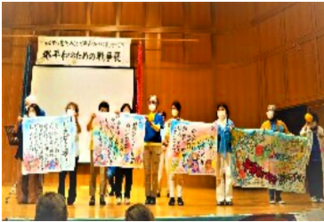
会場に歌声が響き渡りました

絵手紙、折り紙を展示、受付・写真・ビデオ係をわが年金者組合が担当、絵手紙・紙芝居のコーナーを企画しての3年ぶりのリアル開催です。オープニングの 平和の歌 こえに組合員の顔が輝いています。子どもたちからパワーをもらうのが一番の楽しみの 絵手紙をかこう では、朝採り夏野菜が葉書のうえに個性豊かに移っていきます。親子で見合って笑っています。