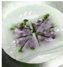
色どりも美しい水無月

してくださったフラワースターチを混ぜたもっちり感とあずきの色どりの美しいお菓子です。