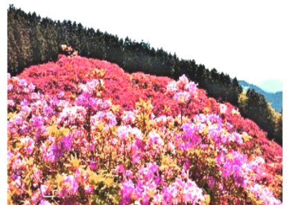
真っ赤なツツジの葛城山