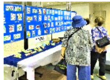
絵手紙に見入る人々

絵手紙、折り紙を展示、受付・写真・ビデオ係をわが年金者組合が担当、絵手紙・紙芝居のコーナーを企画しての3年ぶりのリアル開催です。オープニングの 平和の歌 こえに組合員の顔が輝いています。子どもたちからパワーをもらうのが一番の楽しみの 絵手紙をかこう では、朝採り夏野菜が葉書のうえに個性豊かに移っていきます。親子で見合って笑っています。