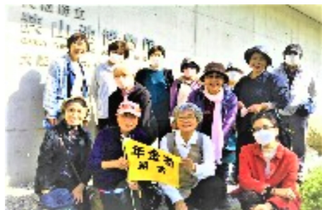
池の土手に至る館の入口でニッコリ

途中で、レンガをアーチ型に積んだ高野線の下の特設トンネルを見学。間歩と書いて、マン