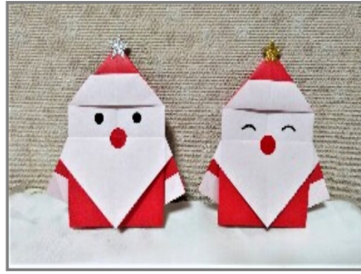
サンタさん 河内 都