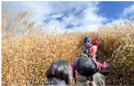
一面のすすきの急坂を登る

河内長野からバスに乗って、山頂目指して一生懸命歩くのみ！ やつとのこと で山頂に着きました。すすきが一面に広がっていて、秋を感じることができました。