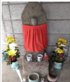
黒土の中池地藏様

黒土町にお住いのN氏のお話を聞く機会がありました。そのお話から、まずは前にも書いた「歯神地藏尊」。もう一つは、「黒土の中池地藏尊」です。2体ともに現在の地域で言うと長曾根地域にあります。