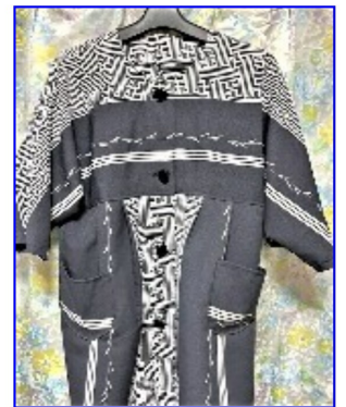
はたおり機で織った 生地で作ったコート