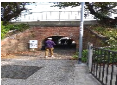
狭山駅そばのマンボウ

中に入ると、日本最古のダム式のため池、狭山池の土木遺産をそのまま保存・展示されていました。昔の人は機械もないのにすごいことができたんだなあと、驚きと感動で、参加してよ