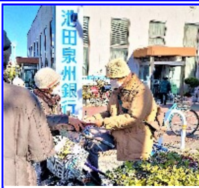
道行く人に訴えました

2か月に一度となる年金支給日の12月15日、支部は池田泉州銀行と金岡郵便局前で「物価上昇に