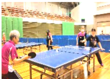
元気いっぱい球に向かう

の記念撮影。この記念撮影はいつもとても賑やかで、他のハイカーの方々の注目の的です。登山のペースは若い方の体力には負けてしまいますが、私たち皆が集まると、本当に明るく賑やかで元気いっぱい笑い声は若い方々にも負けていません。 広場からは山茶花が咲き誇る美しい道が大川栄策の「さざんかの宿」を口ずさみながらの下山。今回は下山後の予定はお楽しみみの忘年会。足取りも軽快で早くあつという間に道の駅ふたかみパーク到着。そして二上神社口駅に。こんなに近場で気軽に登れる二上山ハイキングは眺めも良く自然豊かでいい運動になり気分も上がります。