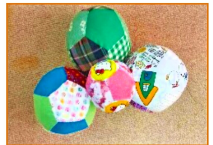
赤ちゃんのてんまり