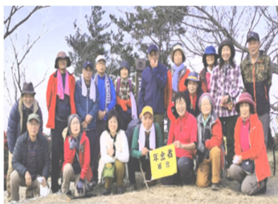
雌岳山頂で笑顔がこぼれます

12月11日(日) 今年最後のハイキングは二上山です。雄岳と雌岳が寄り添って並ぶ二上山はどこからでも眺められる山として私たちの毎日の生活の中でいつも優美な姿を見せてくれていま