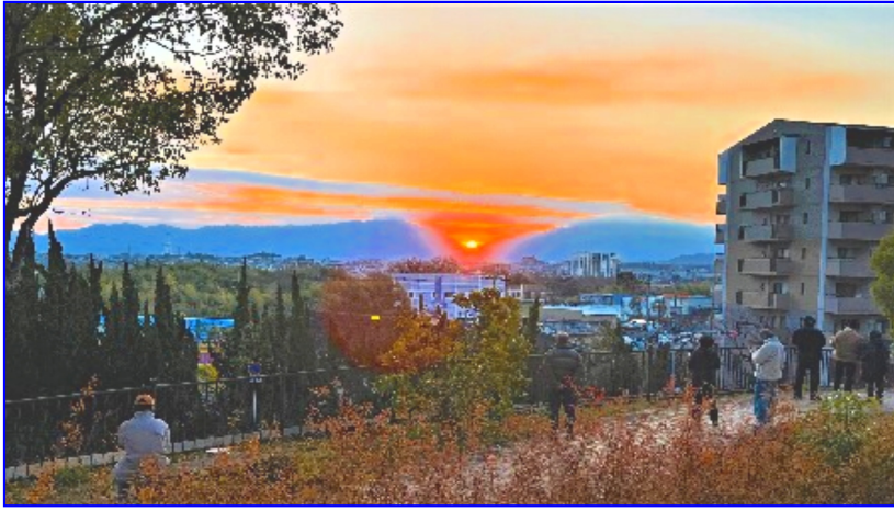
2023年の初日の出

柴さんが狭山の実家から撮った、水越峠（葛城山・金剛山の間）から上がる今年の元旦の写真です。