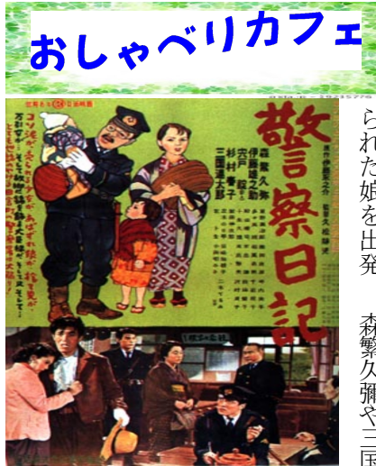
レトロなポスターに懐かしい名が

会津磐梯山麓の小さな町を舞台に、警察官とその町に暮らす人々のエピソードが人情豊かに展開する。お人好しの巡査が捨て子の姉妹の世話をしたり、若い花川巡査が周旋屋にひっかけられた娘を出発