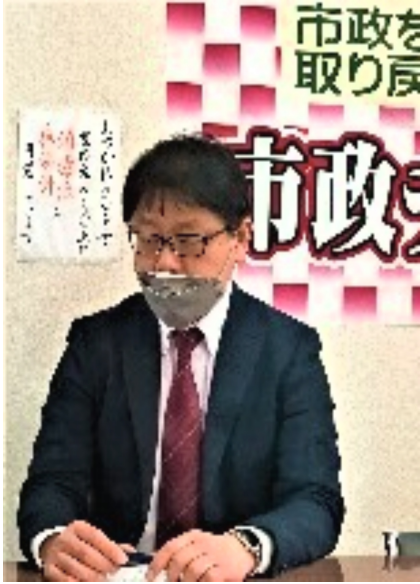
端的に答えて頂きました