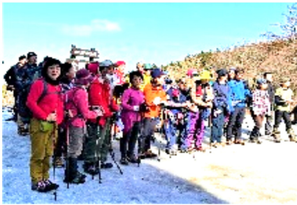
雪の金剛山千早園地にて

登山口より山頂を目指す途中でアイゼンを装着し、ザックザックと雪の中、足元に注意しながら階段を登って行き、道中、安全地藏に頭を下げました。所々に水飲み場があり、谷の静けさを