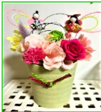
フラワーアレンジ でお雛様を作りま した。