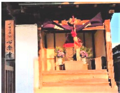
心念寺の門前地蔵様

今年には歴史探訪で1月には松原市の柴垣神社、2月には開口神社節分会へ行き、地元の華表神社へはお参りが遅れていました。華表神社では、神社前にある立派な