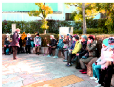
中門の分量石の前で

高野詣や伊勢参りで賑った阿保茶屋跡をめぐり、堺とも縁の深い反正天皇が都とした丹比柴離宮の跡に建ち、歯の神様として知られる柴離