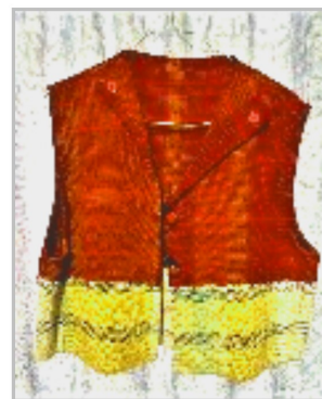
モミの長襦袢を裂いて織機で織ったベストです