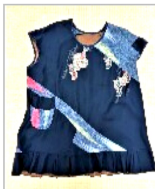
和布でリフォームした子供服です