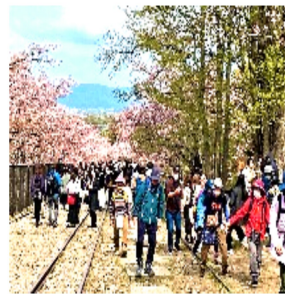
蹴上インクラインを歩く

歴史の重みを感じさせるお雛様巡りでは、親子の子どもに対する思いが伝わりました。楽しいひと時を過ごさせていただきました。上原直美