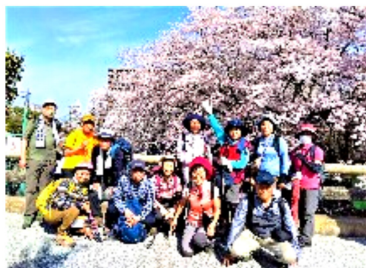
三井寺近くの琵琶湖疎水にて