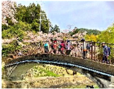
山科疎水の橋上でニッコリ

筏。眼前には満開の桜。途中、桜によく似た白い花が咲いて「アーモンドかぶろしかなあ」「この花も綺麗ね」などと言いながら疎水沿いを