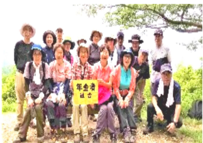
緑と心地よい風と眺望を楽しみ

朝9時、近鉄松原駅に集合。二上山登山口から登り始め、銀峰経由で雌岳直下の馬の背からダイトレ分岐までササユリを求めて歩きましたが、少し時