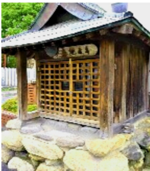
華表神社前のお地藏様