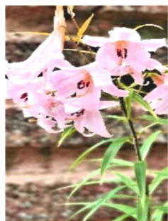
ササユリに出会えた

5月28日に大阪と奈良の県境にある二上山に登りました。朝9時、近鉄松原駅に集合。二上山登山口から登り始め、銀峰経由で雌岳直下の馬の背からダイトレ分岐までササユリを求めて歩きましたが、少し時