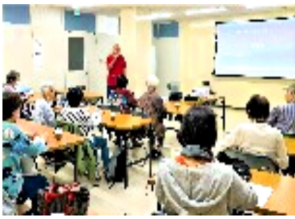
手話を交えてのコーラス

暗唱コンテストが行われることになり、ワジダはその賞金で自転車を買おうと一生懸命コーランの暗唱に取り組むが……。女性ひとりですることや車