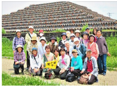
土塔を背にニッコリ

土塔は想像していた以上に大きく、約53m四方の四角錐、きれいに復元整備されています。