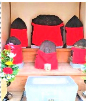
華表神社前のお地藏様