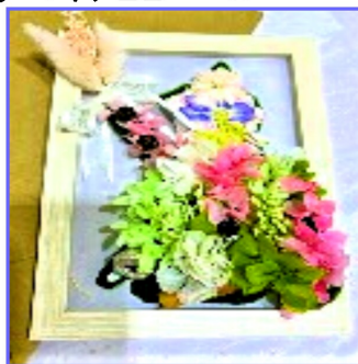
額に押し花とブリザードフラワーを貼り、香りのエッセンスで香り付しました。