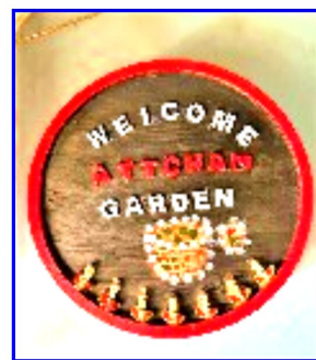
素麺の桶にペンキを塗り、ウエルカムボードをリメイクしました。