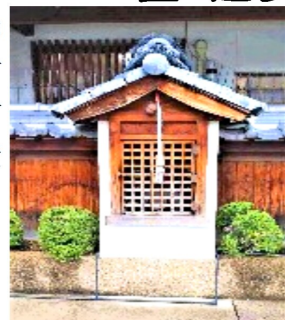
宮本町のお地藏様

さらにMさんにお聞きますと、ここも初めは1体だけで個人のお地藏様だったのが、近所のお地藏様を集めて、近くの方たちでお祀りされるようになったそうです。目立たない場所にあります、庶民の心が一人ひとり籠ったお地藏様たちに思えました。