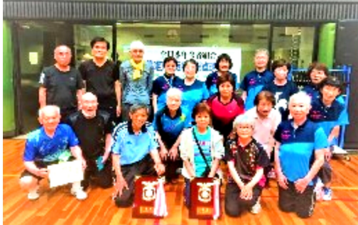
優勝の盾を中心に喜びが溢れました。