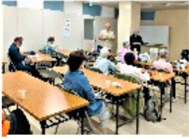
見やすくなった映画会