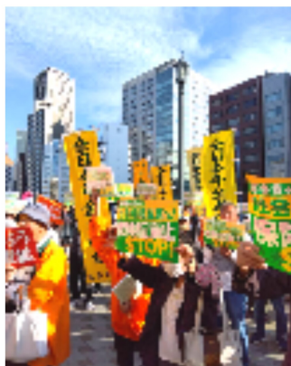
旗やプラカードが圧巻

☆今回、初めて年金一揆に参加しました。淀屋橋に着くと、街宣車から力強い演説が聞こえてきました。橋の上で、横断幕を持って、アピールしました。