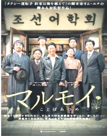
圧力に屈せず、辞書を作る

☆朝鮮の植民地の状況がよく分かる映画でした。私の父は、朝鮮で憲兵をしていたことを思い出しました。