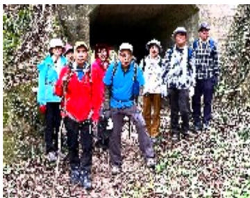
鳴川峠越えの道を行く

平岡山展望台からは河内平野が一望でき、遠くにあべのハルカスや大阪湾も見えます。昼食はなるかわ園地のぼくらの広