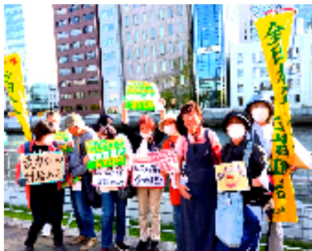
秋晴れの下でニコリ

ステージからも、「賃上げしていけば年金も増える。いのちと暮らしを守る暮らし年金に。声をあげていこう」「介護保険料が高い。女性の