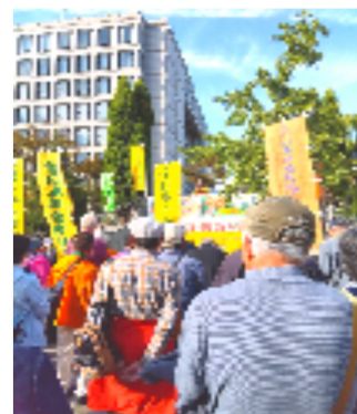
府のあちこちから集結

集会に先立ち、道行く人々に、「物価高なのに、年金が減るのはおかしいでしょう？物価上昇に見合う年金引き上げを！ 75歳以上の医療費が2倍に引き上げられて、ますます大変。保険証の廃止ストップ！ 社会保障の充実を！ 年金引き下げは違憲。人間の尊厳を守れ！」とアピールしました。