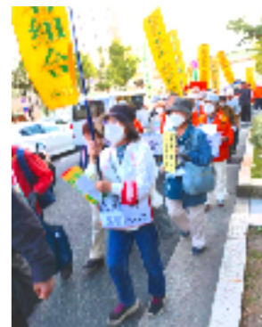
梅田までアピール