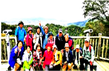
展望台から絶景を見る

深呼吸して土や草の香りを感じ、全身で自然を味わいながら森林浴を堪能したところで、急に視