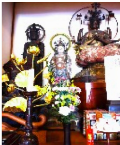
本尊と脇本陣の仏像