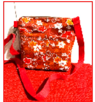
帯を利用してセカンドバッグを作りました。