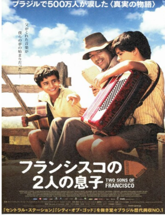
ブラジルで500万人が涙した(真実の物語) 父を失った次男が、母の夢を継ぐ。兄弟の絆が涙を誘った。 「セントラル・ステーション」「シティ・オブ・ゴッド」を複数回々々ブラジル版代演NO.1 フランシスコの2人の息子 TWO SONS OF FRANCISCO 「セントラル・ステーション」「シティ・オブ・ゴッド」を複数回々々ブラジル版代演NO.1

る。貧しい生活から抜け出すためにプロのミュージシャンを目指す。そんな2人を愛情豊かに支える父。次男が交通事故で命を落とすが、いつしかその弟が音楽への道を歩み…。困難に直面しながらも強い絆で結ばれた父子のひたむきさが胸を打ちました。