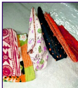
ハギレで作ったポーチ