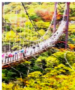
ゆれる吊り橋を渡って